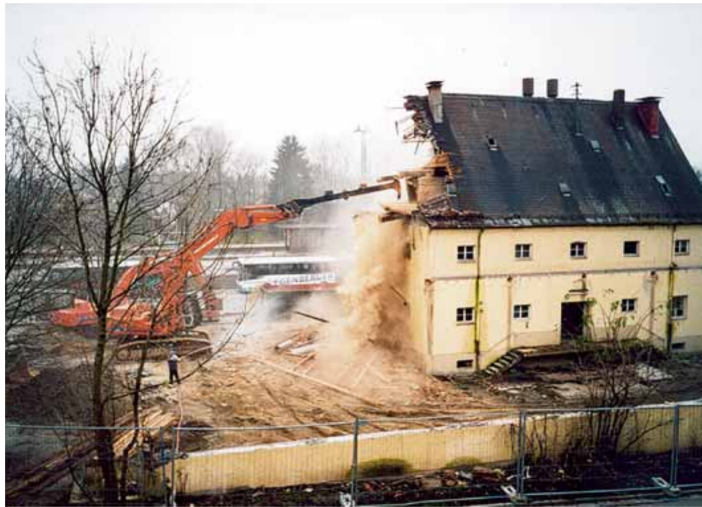
Im Jahr 2002 war die Firma für den Abriss des alten BayWa-Gebäudes und anschließend für die Schadstoffentsorgung verantwortlich. Das neue Bay-Wa-Gelände ist jetzt in der Unterberger Straße 9-11 zu finden.