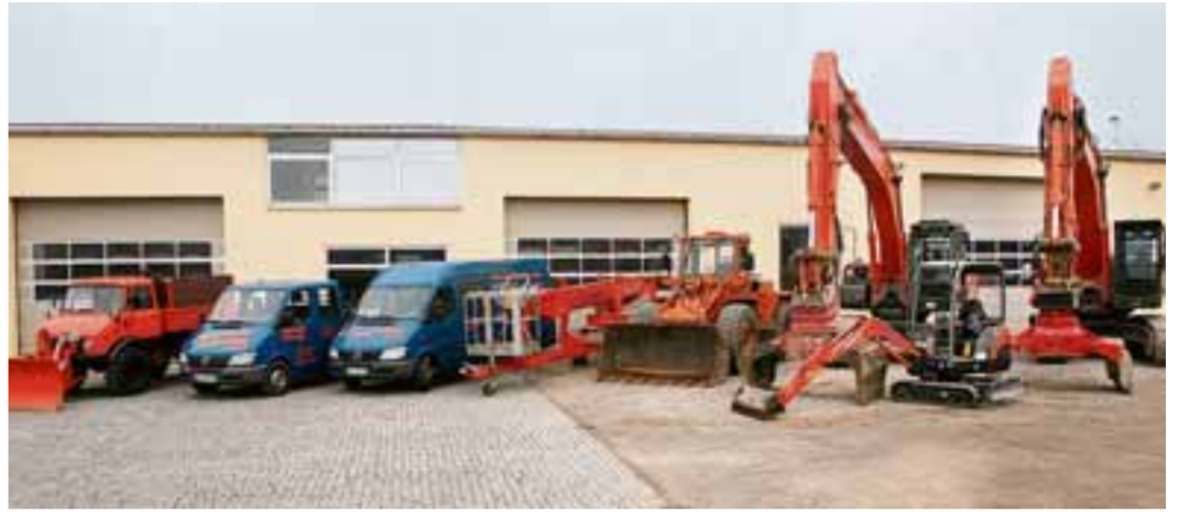
Der voll ausgestattete Fuhrpark erlaubt dem Unternehmen ein breites Leistungsspektrum – vom Privathaus bis hin zu kontaminierte Industrie- oder Fabrikgebäude.

draulikbagger mit kompletter Abbrucharüstung, ein Minibagger, ein Radlader, eine Hebebühne und drei Seilbagger der 20- bis 50-Tonnen-Klasse. Breites Leistungsspektrum Damit deckt die Firma Schreiner ein großes Einsatzfeld ab. Ob es sich um einen Abriss eines Wohnhauses oder eines komplizierten Industriegebäudes handelt – die Schreiner Abbruch GmbH verfügt nicht nur über die passenden Maschinen, sondern auch über ein fundiertes technisches Know-how. Ein berühmtes lokales Beispiel ist das alte BayWa-Gebäude in Mering, wo die Abbruch-